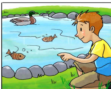
INTRODUCI I PESCI IN VASCHE E FONTANE.