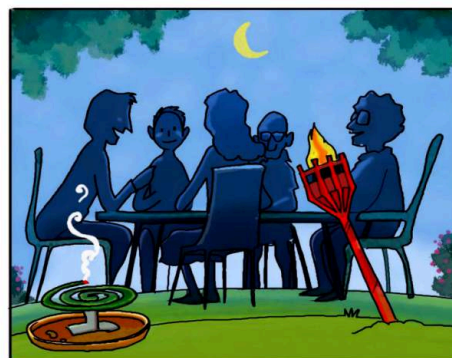
QUANDO SOGGIORNI ALL'APERTO, PROTEGGITI CON REPELLENTI AMBIENTALI. (*)

(*) Leggi attentamente le istruzioni riportate sulle confezioni.