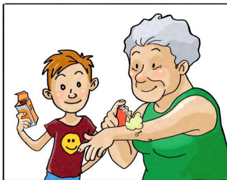
USA I REPELLENTI CUTANEI SEGUENDO LE INDICAZIONI RIPORTATE SULLE CONFEZIONI.