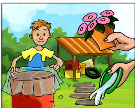
METTI AL RIPARO DALLA PIOGGIA TUTTO CIÒ CHE PUÒ RACCOLGERE ACQUA.

(*) Leggi attentamente le istruzioni riportate sulle confezioni.