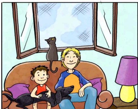
IN CASA USA LE ZANZARIERE ANZICHÉ ZAMPIRONI E FORNELLETTI.